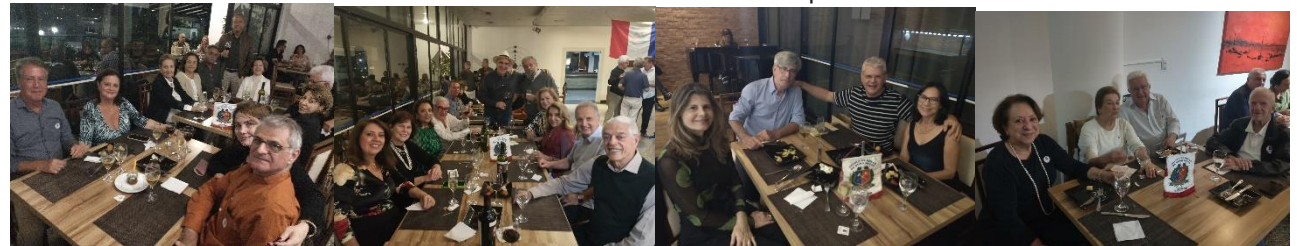
Encontros e muitas alegrias