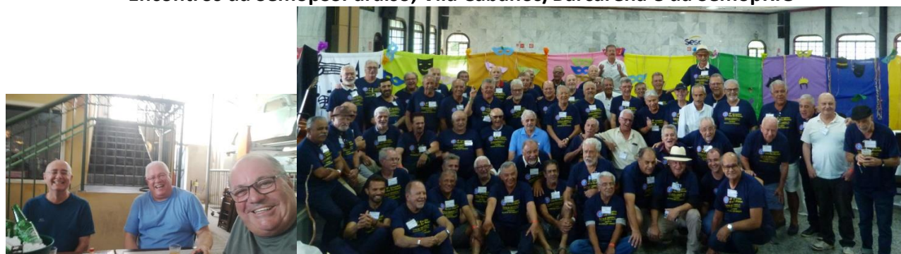
SemopSorocaba/SP. 80 anos da ETFOP, as Turmas de 1967 até 1972