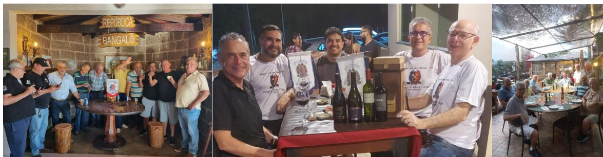
Encontros da SemopSPParaíso, Vila Cabanos/Barcarena e da SemopRIO