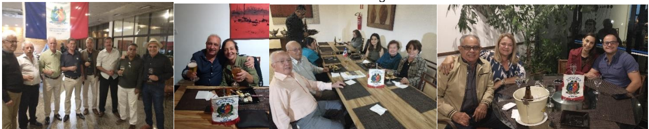
Muitas alegrias e só alegria.