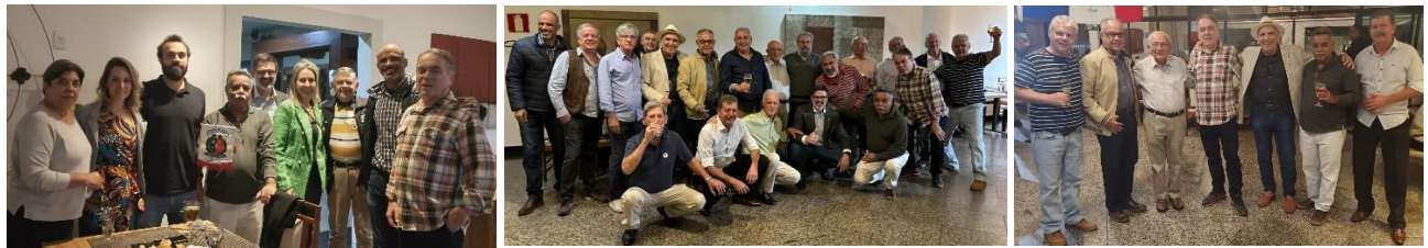
Jantar do Namorados da SemopBH