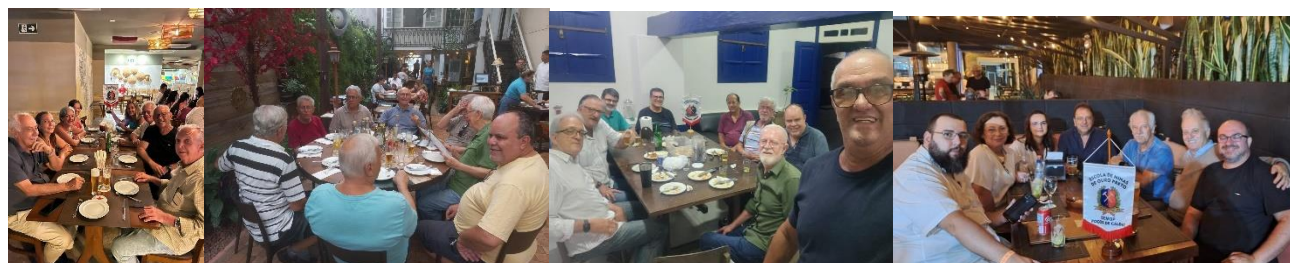
Encontros Semopianos: Em Aracaju, Rio, Ouro Preto e Poços de Caldas.