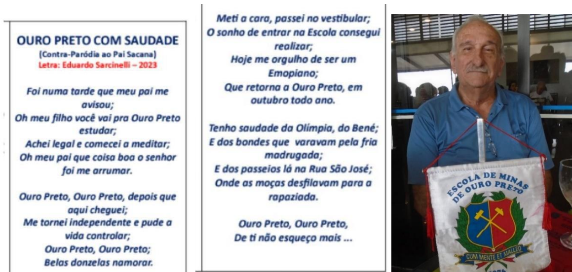
Nova letra de “Ouro Preto com Saudade” de Eduardo Batista Sarcinelli-EM/1969