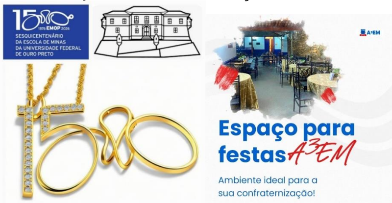
Selo de Comemoração do Sesquicentenário da Escola de Minas de Ouro Preto. A Casa do Antigo Aluno restaurada e bonita pronta para receber hospedes.