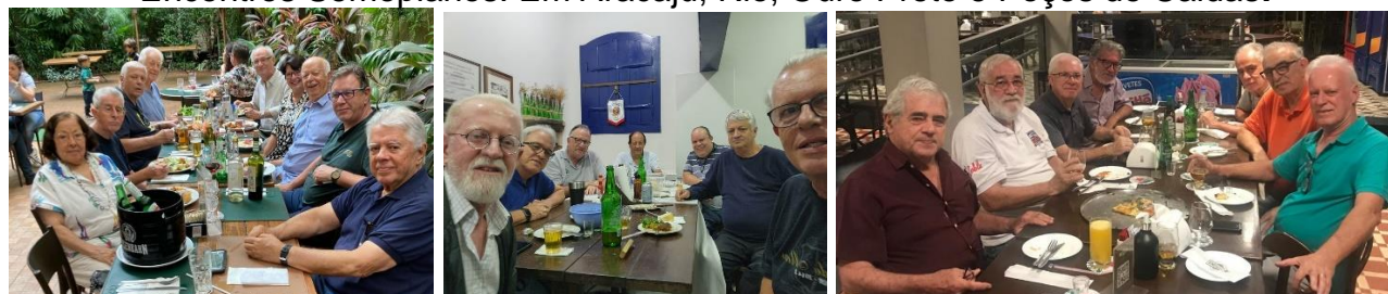
SemopRio com visitantes, SemopGorceix toda terça, Turma de 1973 . Numa Quarta-feira venha participar de um Encontro da SemopBH SemopBH 51 anos de Tradição EMOPIANA