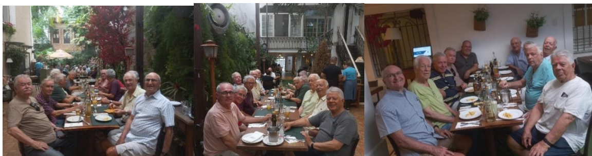
SemopRio uma Tradição de mais de 60 anos.