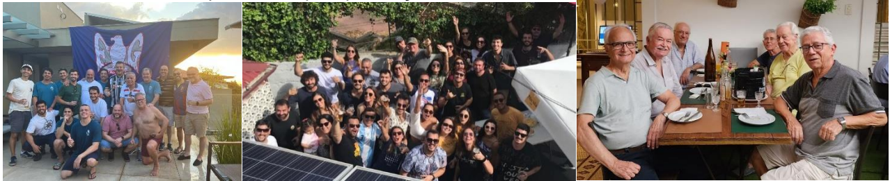
Turma da FG, Encontro em Lisboa, SemopRio