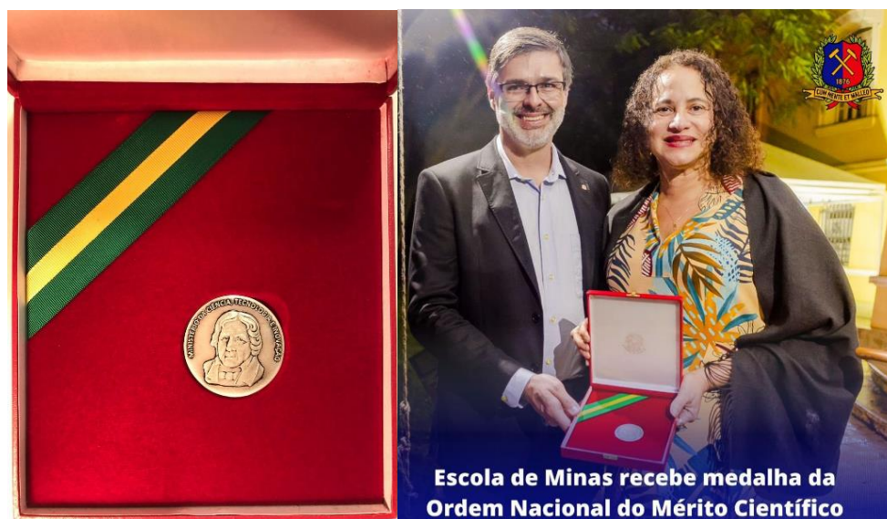
Escola de Minas recebe medalha da Ordem Nacional do Mérito Científico