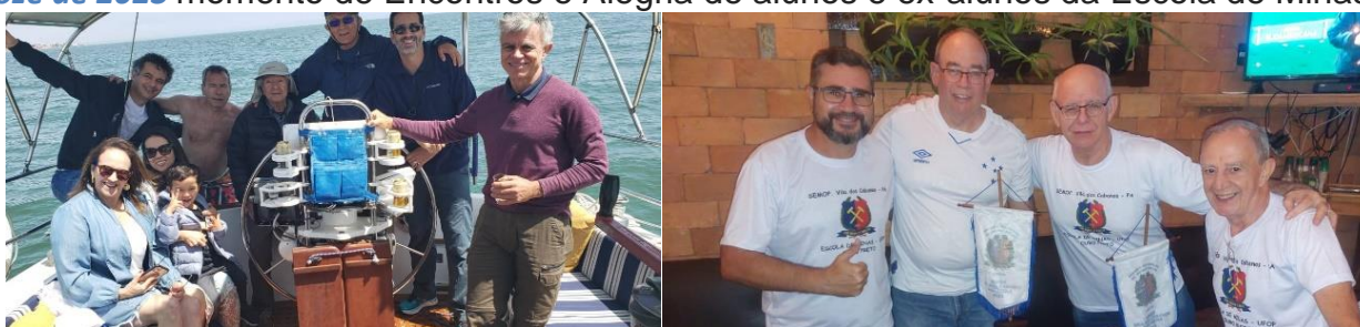
Emopianos em no Pacífico/Lima no late Luccia/Jorge Cardenas, Semop Vila Cabanos

Doze de 2023 momento de Encontros e Alegria de alunos e ex-alunos da Escola de Minas