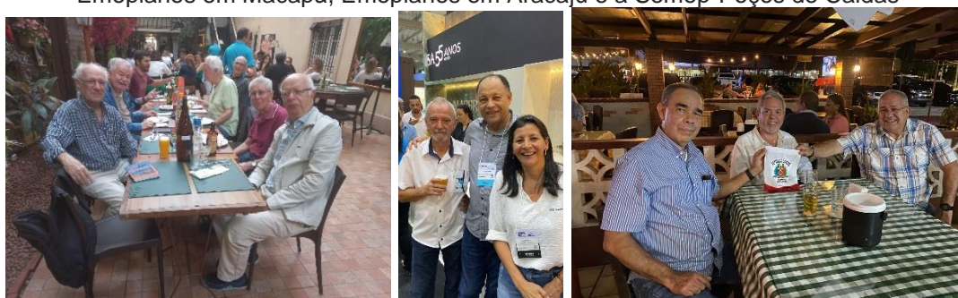
Semop-Rio, Emopianos na Feira de Granitos/Cachoeiro do Itapemirim, Semop-Panamá