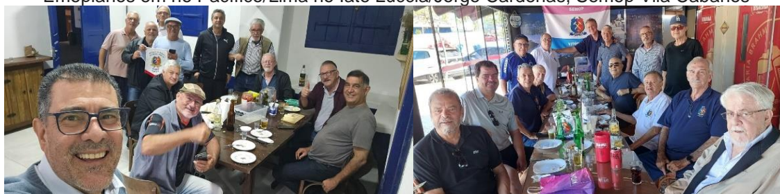
Semop-Gorceix e Semop-ES