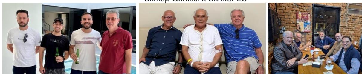
Emopianos em Macapá, Emopianos em Aracaju e a Semop-Poços de Caldas