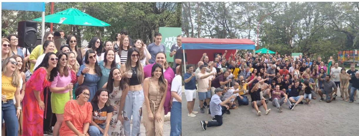
Dia 2/09/2023 Encontro da SemopVale do Aço em Ipatinga