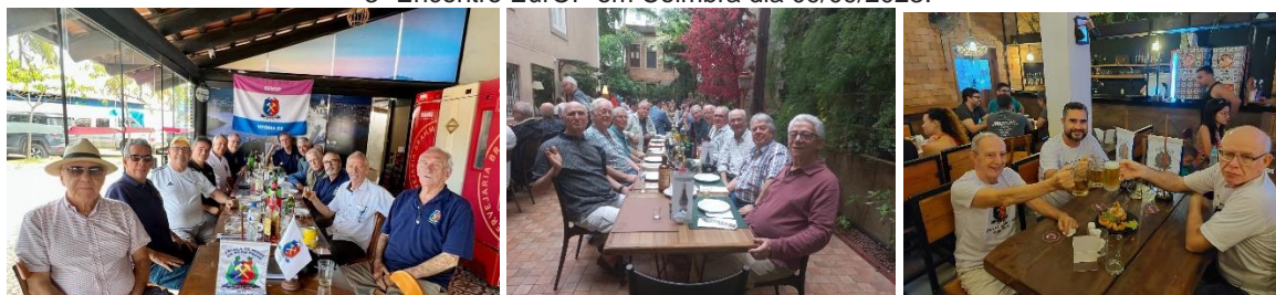
Vitória – Rio - Vila Cabanos

SEMOP ES - SOCIEDADE DOS EX-ALUNOS DA ESCOLA DE MINAS DE OURO PRETO – REGIONAL ES (FILIADA À A3EM)