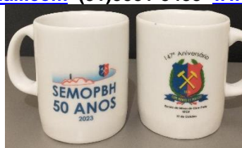
Caneca comemorativa do Cinquentenário da SemopBH

a3em.hg@gmail.com (31)3551-5488 www.a3em.org.br