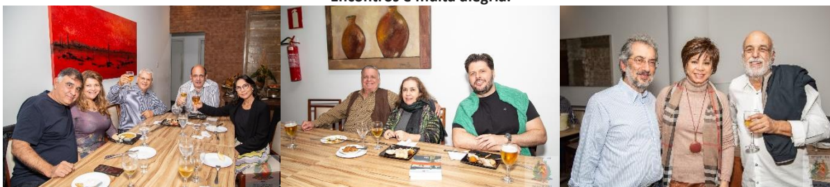
Alegria de Encontros e Amizade.