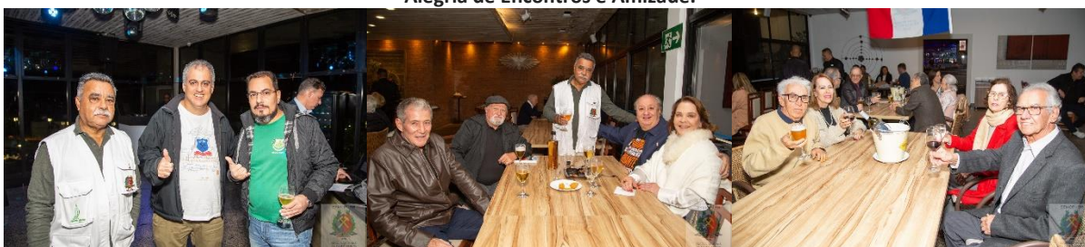
Este foi aquele Encontro.