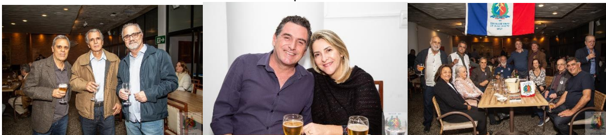
Uma noite feliz. Viva a Escola de Minas de Ouro Preto!