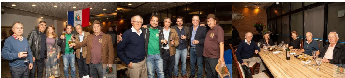
Encontros e muita alegria.