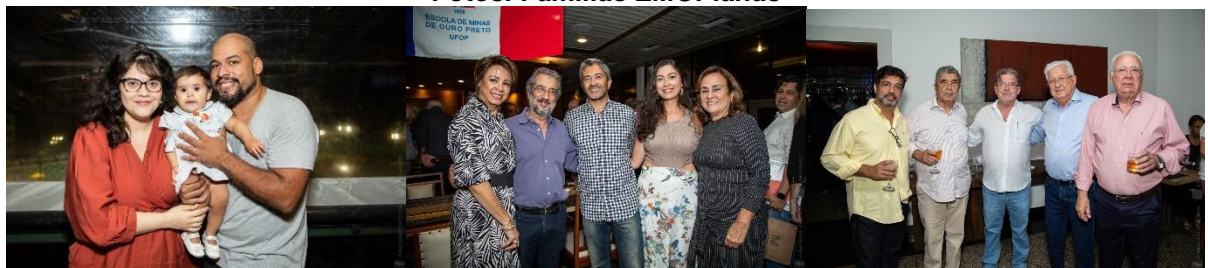
Fotos: Famílias EMOPianas a mais nova participante.