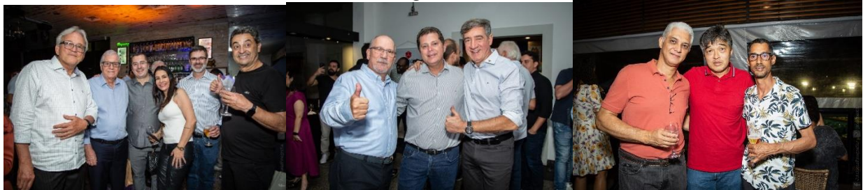
Fotos: Professores e Diretores e reencontro de antigos alunos