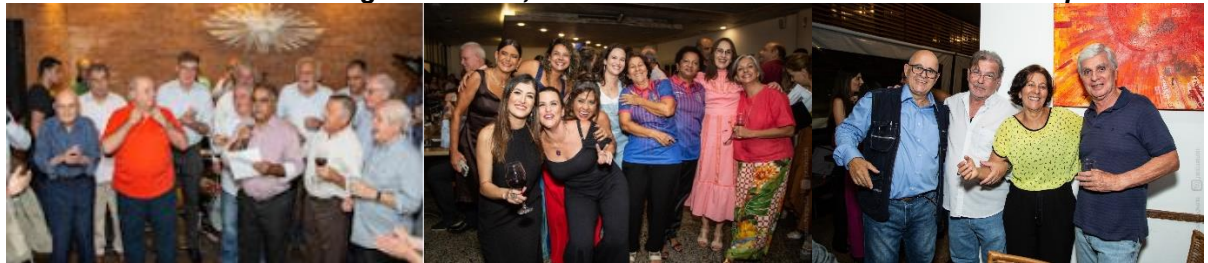
Fotos: Em defesa da Escola de Minas, Engenheiras a camisa da SemopBH e encontros