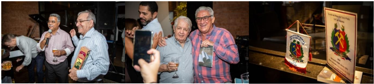
Fotos: Sorteio da Pinga do Juarez, do Livro de Dr. Ivan e Bandeiras da SemopBH