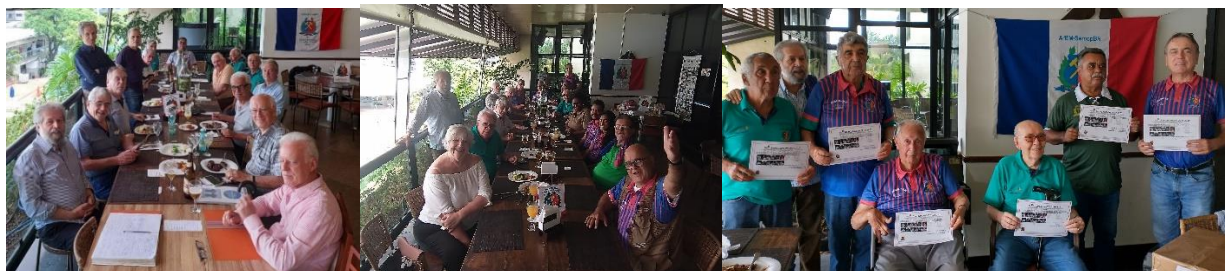
1º Encontro de 2023 ano do 50º Aniversário da SemopBH, festa em 24 de março. 12 Semopianos especiais que foram agraciados com o Diploma SemopianoBH Ouro 2020, 2ª Edição .