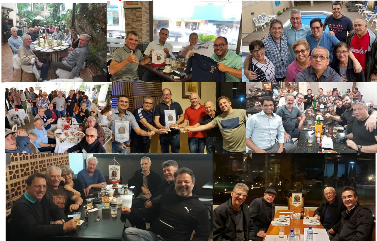
Rio-Panamá-Paraguay-Vitória-Vila Cabanos-Vale do Aço-Poços de Caldas-Lima