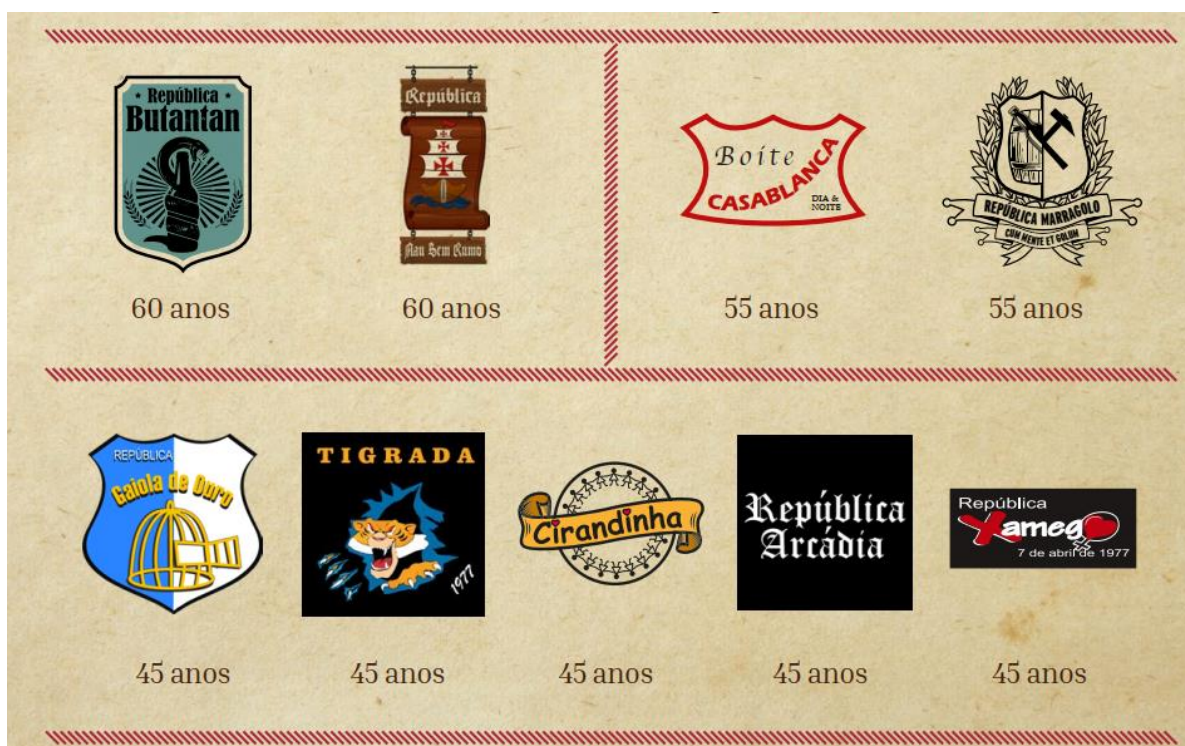
Homenagens da Escola de Minas às Repúblicas

Ser Engenheiro pela Escola de Minas é merecer a confiança como os relógios suíços, a casimira inglesa e o champanhe francês ... (Revista Manchete Nº 154 de 26/06/1954 – Informativo SemopBH nº 155).