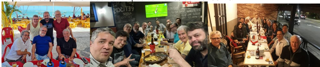
Salvador – Ipantinga – Poços de Caldas

Esquentando para o Doze de 2022 após os 2 anos de IPandemia: