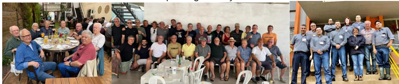
SemopRio - Segundo Paraíba Fest 2022 - 87 anos da Arcelor Mittal/João Monlevade