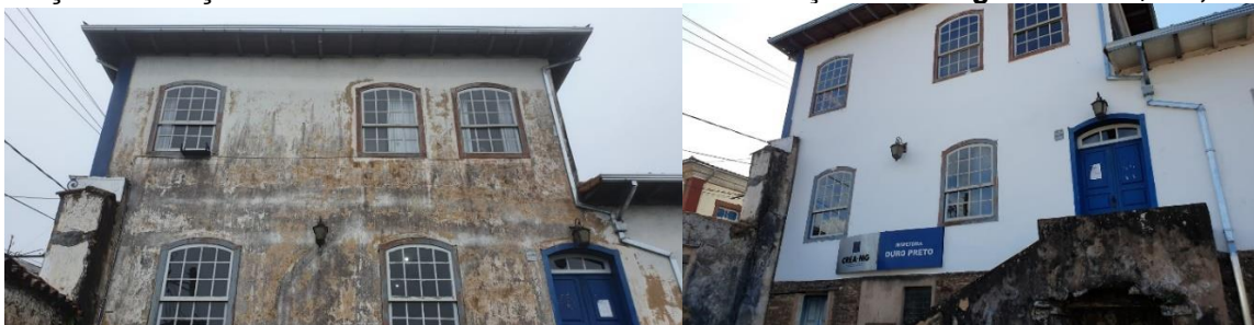
Veja como as Colaborações estão sendo aplicadas: Antes e Hoje (Julho de 2022)

Contribuição Anual Voluntária a AAAEM, valor sugerido R$100,00 Campanha do Restauo da Casa do Antigo Aluno da Escola de Minas. Colabore faça um PIX o nº é o CNPJ 18.295.766/0001-06 - ITAÚ – Agência 8119 – Conta 20.525-3 - a3em.hg@gmail.com - (31)3551-5488 faça sua doação de Nossa Casa: 1/50 do valor da Instalação de Energia Solar: R$500,00