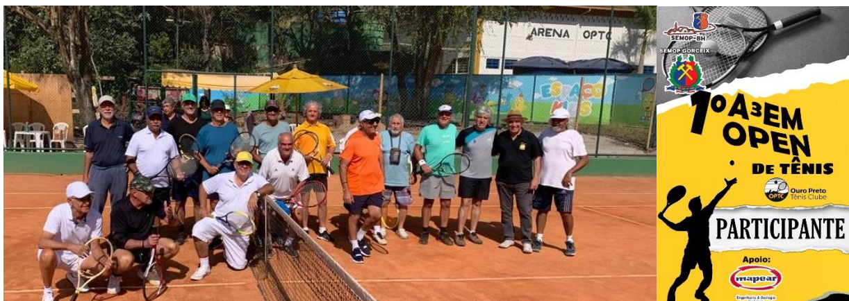
1º A³EM OPEN de Tênis realizado em 06/08/2022. SemopBH x Semop Gorceix, no OPTC

Histórias no Livro “Homens de Ouro Preto. Memórias de um Estudante” Pedro Demóstenes Rache-EM/1901 Cap II: Recordações “Antecedentes do Exame de Admissão à Escola de Minas de Ouro Preto: