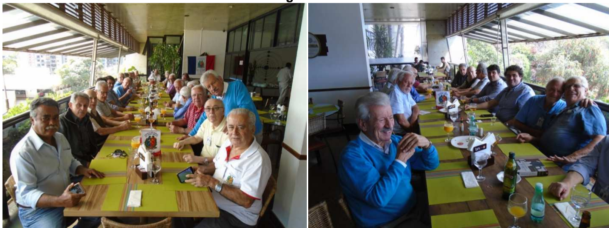
Toda quarta é assim mesa cheia com várias gerações Emopianas.