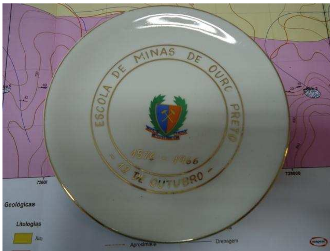
Brinde do 12 de Outubro de 1966

Agende: Dia 7/Setembro/2011, quarta, Feijoada Emopiana no Minas II Preço: Homem R$40,00 - Mulher R$30,00