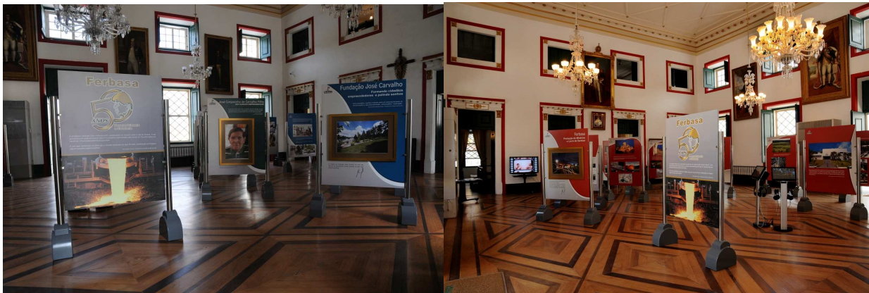
Foto da Exposição da FERBASA – Companhia de Ferro Ligas da Bahia, empresa fundada pelo engenheiro José Corgosinho de Carvalho Filho , Turma 1955, que completa 50 anos em 2011. Uma exposição itinerante, “ Ferbasa – 50 anos de Desenvolvimento e Cidadania ”, com o objetivo de estimular o empreendedorismo com responsabilidade social no empresariado e na juventude brasileira. A exposição esteve aberta à visitação pública em Ouro Preto – MG, na Casa dos Contos, no período de 11 a 28 de Agosto.