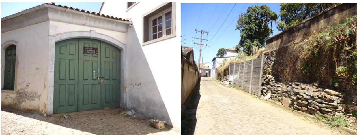
Foto 1: Sede da SEE-Sociedade Excursionista e Espeleológica, nossa Spé, a mais antiga sociedade de espeleologia da América do Sul fundada em 1937, uma amostra da dedicação e abnegação de alunos da Escola de Minas durante 74 anos de existência. Foto 2: Muro dos fundos da Casa do Antigo Aluno da Escola de Minas, CA 2 EM, no Beco da Ferraria, precisando de ser recuperado.