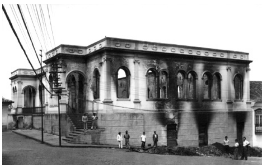
Foto: O Fórum de Ouro Preto após o incêndio. CAEM 96 anos em 2011.