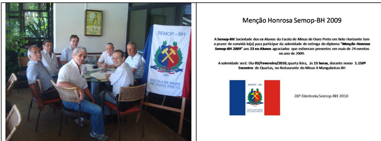
Foto: A 28ª Diretoria da Semop-BH que reúne-se na primeira quarta-feira do mês a partir das 11 horas no Restaurante do Minas II, Mangabeiras – BH, e o Convite para a entrega do Diploma de Menção Honrosa da Semop-BH 2009, 23 ex-Alunos que freqüentaram mais de 24 eventos no ano.

Em 2010 seja um dos 10 a mais para conseguirmos alcançar a marca de 2010 presenças.