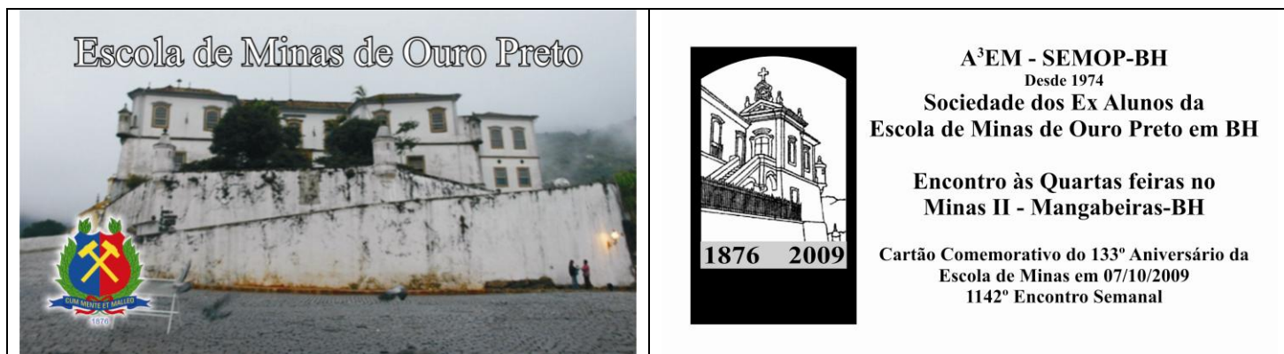
Cartão da Semop-BH alusivo ao 133º Aniversário da Escola de Minas . A tradição que demonstra que com o passar dos anos a Escola de Minas é nossa casa.