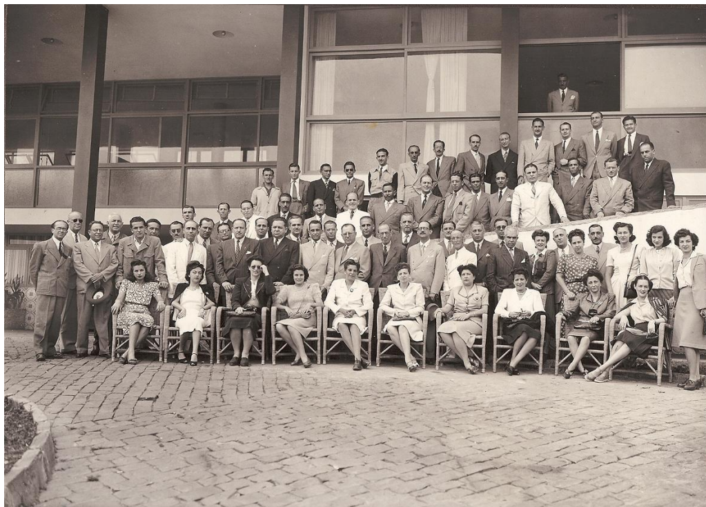
Foto: Comemoração do 12 de Outubro em 1942, Assembléia e Almoço no Grande Hotel, com as Turmas que comemoravam Jubileu de Ouro e Prata e familiares, Professores e ex-Alunos.

Na ART, no campo denominado ENTIDADE, coloque 0019 – é o código da A³EM.