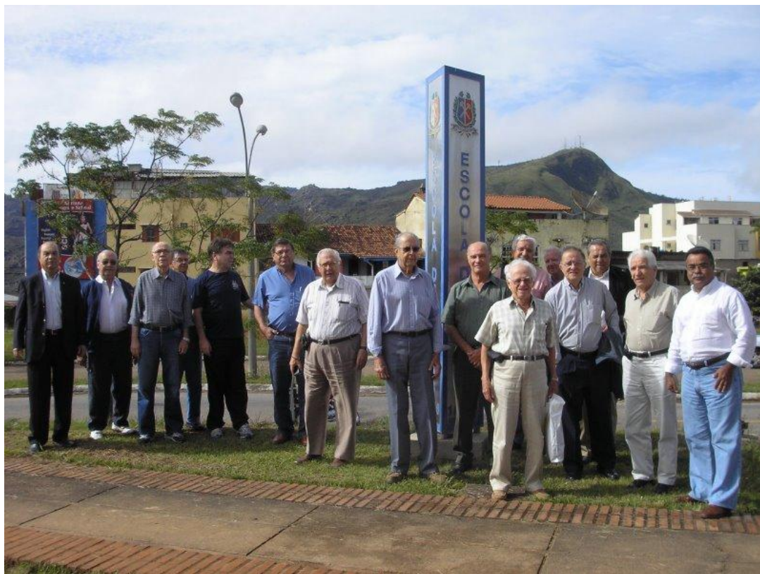
Foto: Ex-Alunos da Semop-BH chegando no Escola de Minas do Campus da UFOP no Morro do Cruzeiro

Na ART, no campo denominado ENTIDADE, coloque 0019 – é o código da A 3 EM.