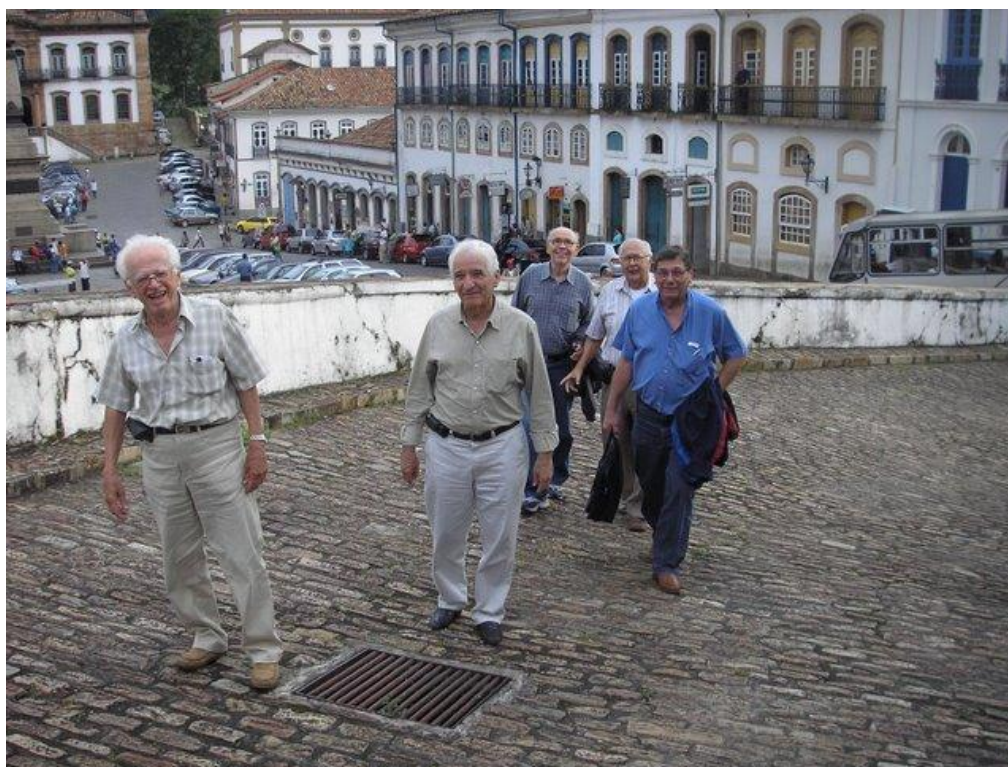
Foto: A chegada dos ex-Alunos da Semop-BH na Escola de Minas, saudades e lembranças....