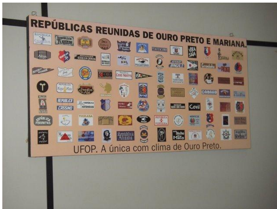
Foto: Quadro com as Repúblicas de Ouro Preto da UFOP.