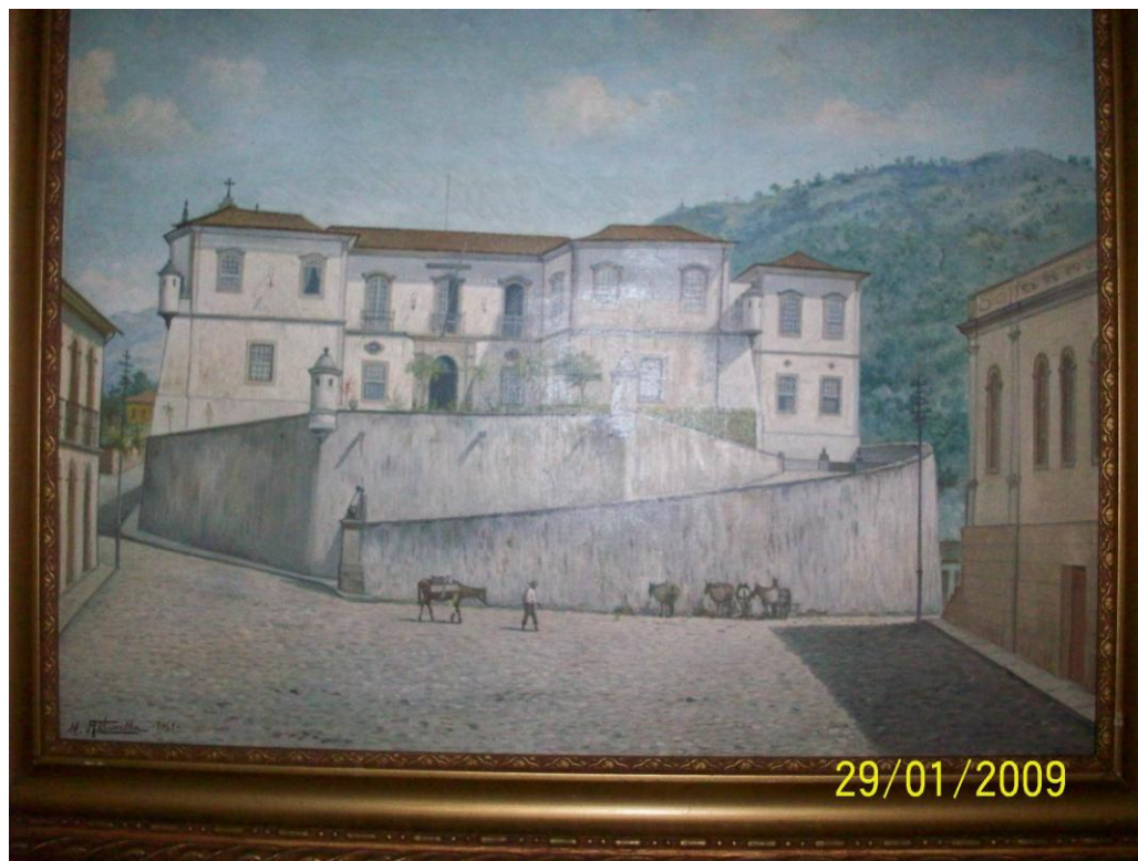
19ª Tela: Na entrada do 4º Andar da Fundação Gorceix a tela em óleo de N. Altavilla , de 1961.

Pinacoteca Emopiana: Se você tem pinturas, desenhos, gravuras, aquarelas que retratam nossa Escola de Minas de Ouro Preto, mencionando a quem pertence e quem é o autor envie-nos a foto em jpg.