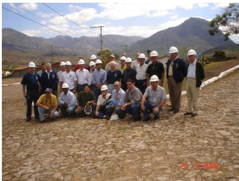
Foto: A Comitiva da Semop-BH com os Engenheiros da Samarco, ao fundo o Pico do Frazão