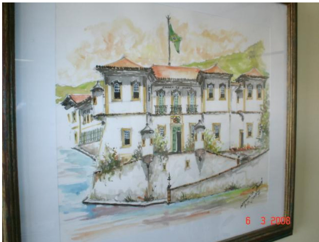
5ª Tela: Aquarela em quadro na sala da Diretoria da Escola de Minas , autor M. Tremenbo