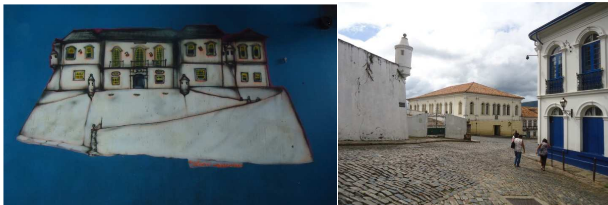
81º Quadro: Desenho na parede do CAEM, foto do CAEM, 26 de Outubro 2015 - Centenário.

Pinacoteca Emopiana: Aguardamos pinturas, desenhos, gravuras, aquarelas que retratam nossa Escola de Minas de Ouro Preto , mencionando a quem pertence e quem é o autor, a foto em jpg.